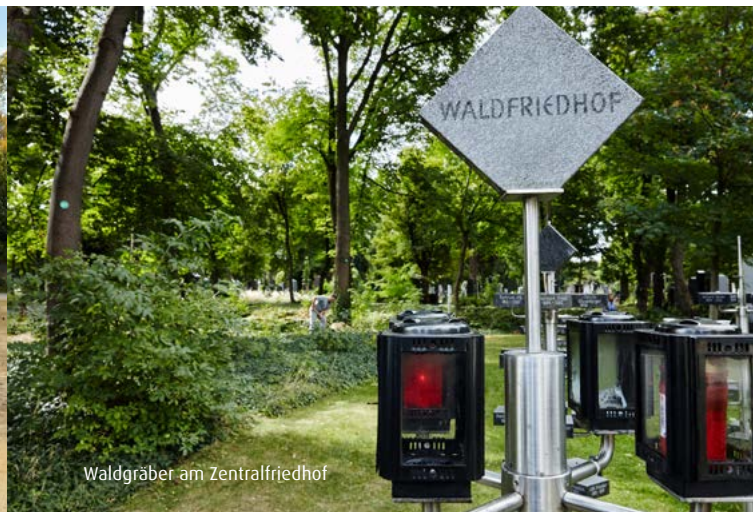
Waldgräber am Zentralfriedhof