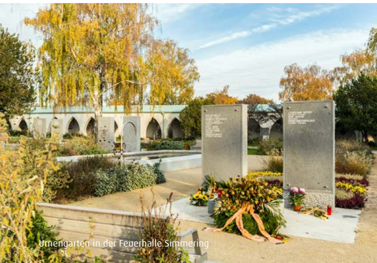
Urnengarten in der Feuerhalle Simmering