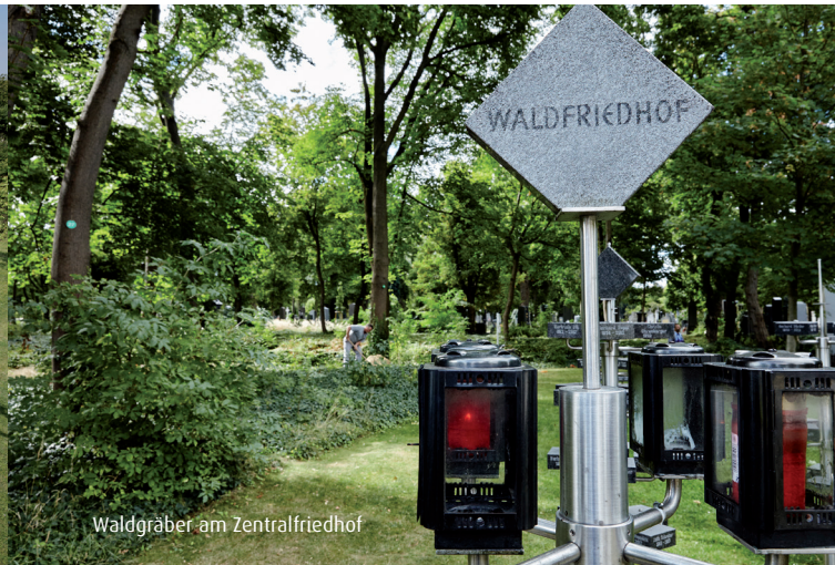
Waldgräber am Zentralfriedhof