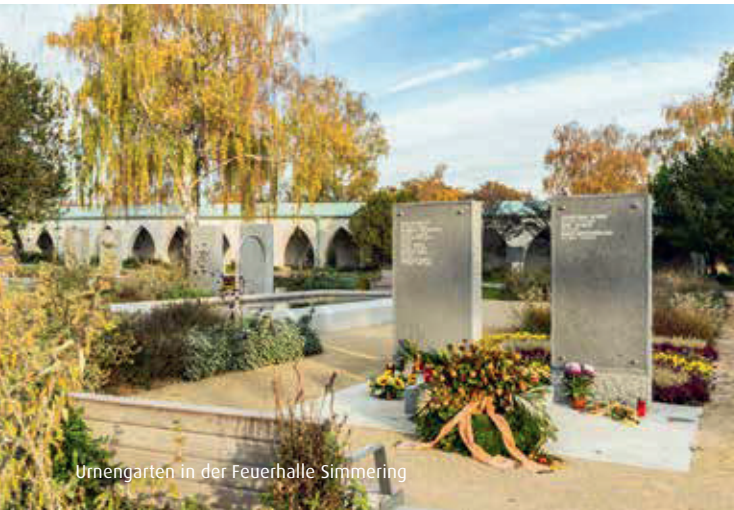
Urnengarten in der Feuerhalle Simmering