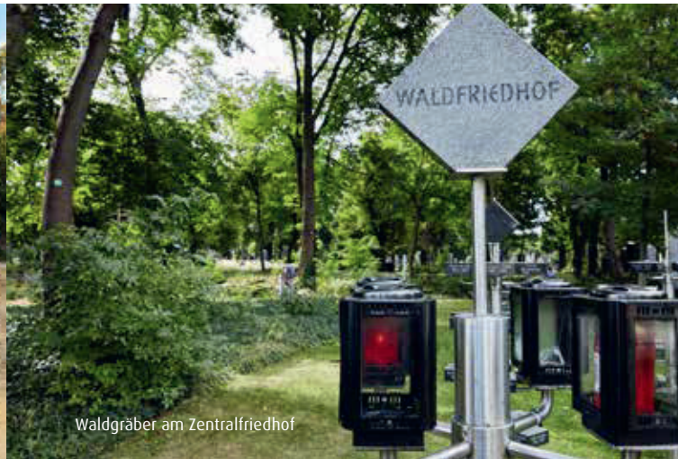
Waldgräber am Zentralfriedhof

Das Symbol des Baumes, Strauches oder Rasens verbindet uns mit der Natur. Die laufende Betreuung erfolgt über die Friedhöfe Wien. Damit können Sie Kraft aus diesen harmonischen Orten schöpfen, ohne ihre Zeit mit Grabpflege zu verbringen.